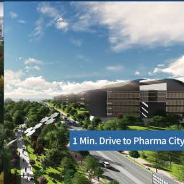
1 Min. Drive to Pharma City