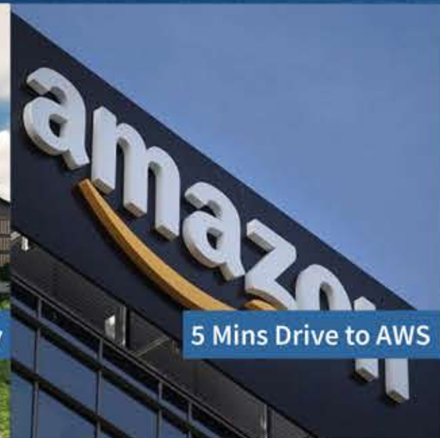
5 Mins Drive to AWS