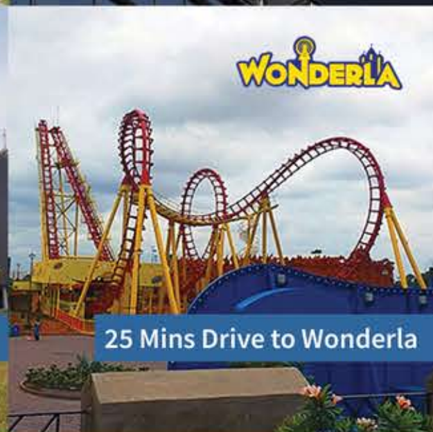
25 Mins Drive to Wonderla