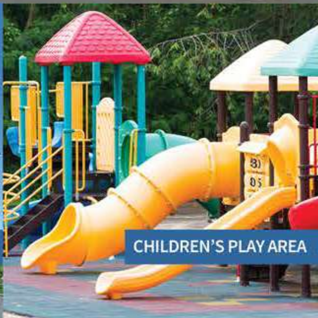
CHILDREN'S PLAY AREA