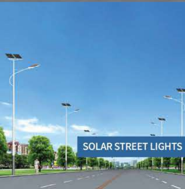
SOLAR STREET LIGHTS