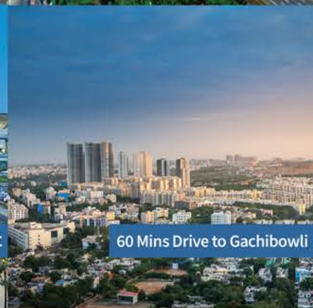
60 Mins Drive to Gachibowli