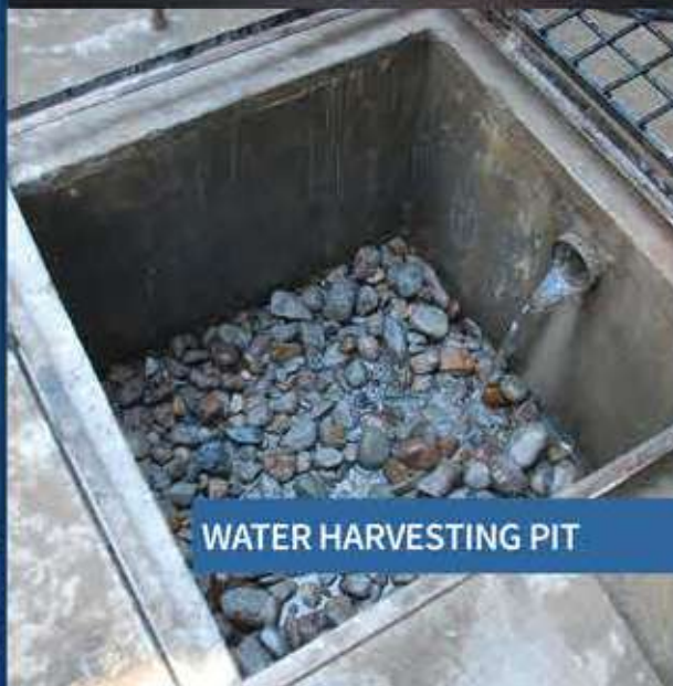
WATER HARVESTING PIT