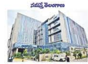
రూ.36,300 కోట్లతో ఏర్పాటు

హైదరాబాద్ లోని ఖైరతాబాద్ లోని 19,333 ఎకరాల విస్తీర్ణంలో ఏర్పాటు చేయబడుతున్న హైదరాబాద్ ఫార్మా సిటీ ప్రపంచంలోనే అతిపెద్ద ఫార్మా సిటీగా నిలిచింది. ఈ ప్రాజెక్టుకు రూ.36,300 కోట్లతో ఏర్పాటు చేయబడుతుంది. ప్రాజెక్టును పూర్తి చేసిన తర్వాత, ప్రపంచంలోనే అతిపెద్ద ఫార్మా సిటీగా నిలిచింది.