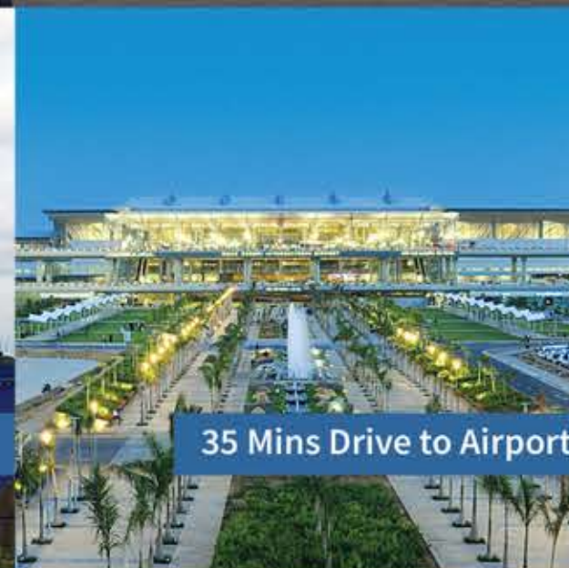
35 Mins Drive to Airport