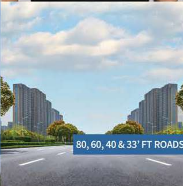
80, 60, 40 & 33' FT ROADS