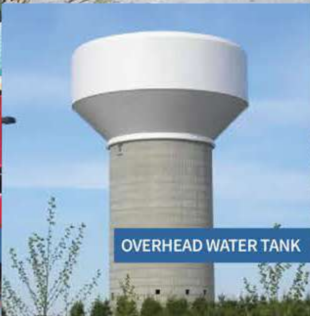
OVERHEAD WATER TANK