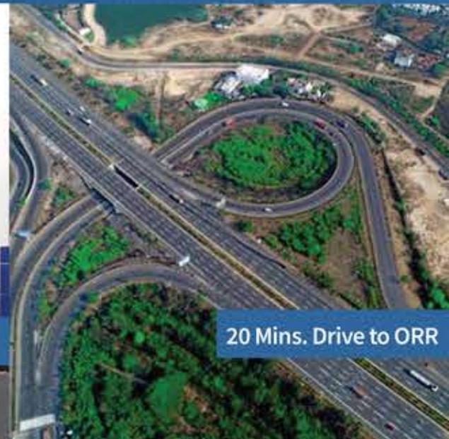
20 Mins. Drive to ORR