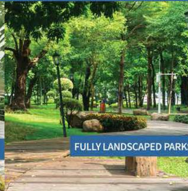
FULLY LANDSCAPED PARKS