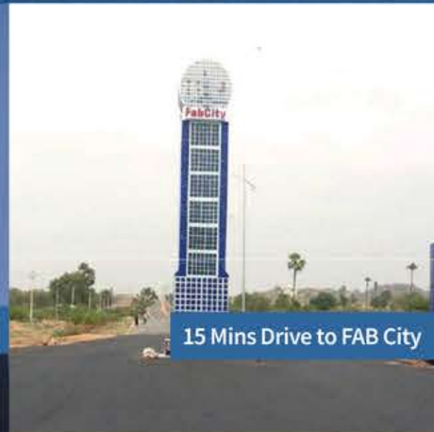
15 Mins Drive to FAB City