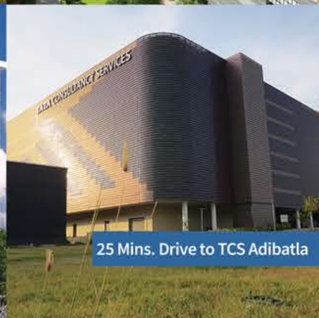
25 Mins. Drive to TCS Adibatla